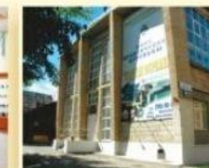
Дом спорта УГГУ ул. 8 Марта, 84А