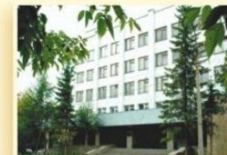
4-й уч. корпус пер. Университетский, 7 ИНЖЕНЕРНО-ЭКОНОМИЧЕСКИЙ ФАКУЛЬТЕТ