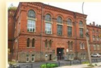
2-й уч. корпус пер. Университетский, 9 ГОРНОТЕХНОЛОГИЧЕСКИЙ ФАКУЛЬТЕТ