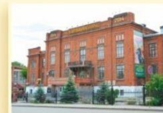
1-й уч. корпус ул. Куйбышева, 30 ГОРНОМЕХАНИЧЕСКИЙ ФАКУЛЬТЕТ ФАКУЛЬТЕТ ГОРОДСКОГО ХОЗЯЙСТВА