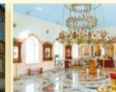
Храм Святителя Николая Чудотворца ул. Куйбышева, 39