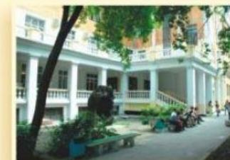
3-й уч. корпус ул. Хохрякова, 85 ФАКУЛЬТЕТ ГЕОЛОГИИ И ГЕОФИЗИКИ