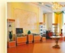
Уральский геологический музей ул. Хохрякова, 85